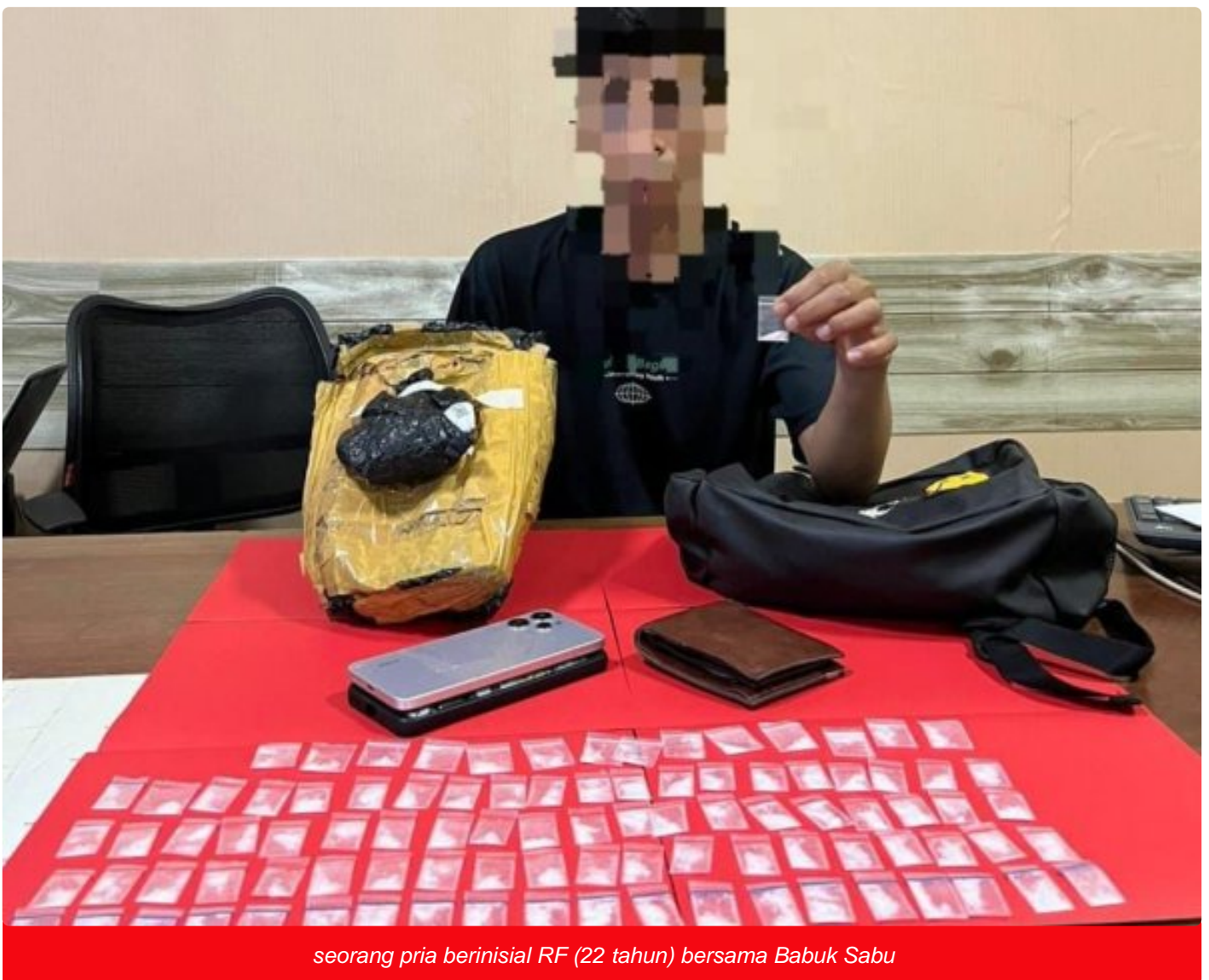
seorang pria berinisial RF (22 tahun) bersama Babuk Sabu

MOROWALI, Sulawesi Tengah- Personel Satuan Reserse Narkoba (Satresnarkoba) Polres Morowali kembali menunjukkan komitmennya dalam memberantas peredaran narkotika di wilayah hukumnya pada hari Senin pagi