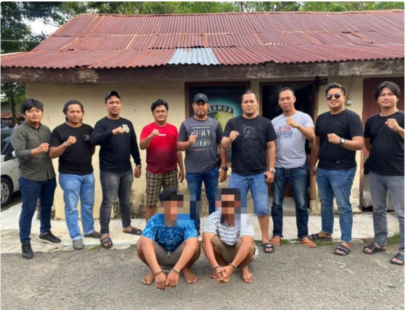
Tim Resmob Reskrim Polres Morowali saat menangkap pelaku pembunuhan

MOROWALI, Sulawesi Tengah- Pelaku penikaman perut terburai keluar hingga menyebabkan korbannya meninggal dunia inisial E (29) yang baru-baru ini terjadi di wilayah Kecamatan Bahodopi telah berhasil di tangkap Satreskrim Polres